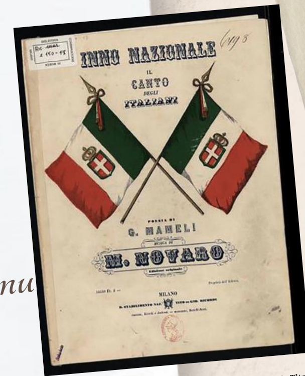
Copertina dell'edizione del 1860 del 'Canto degli Italiani' stampata da Tito Ricordi