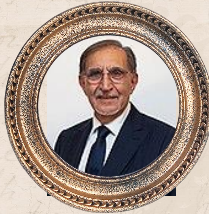
Ignazio La Russa

Presidènti di lu Senatu di la Repubblica