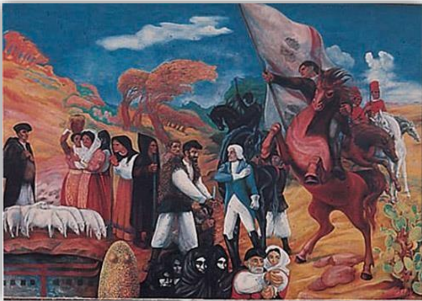
“Li moti antifeudali” pintùra di Aligi Sassu

La disirpirata e eroica próa rivoluzionaria di bucani la Saldigna da lu poteri sabaudu éra durata déci dì e si vinìsi a cumprì in Lungòni.